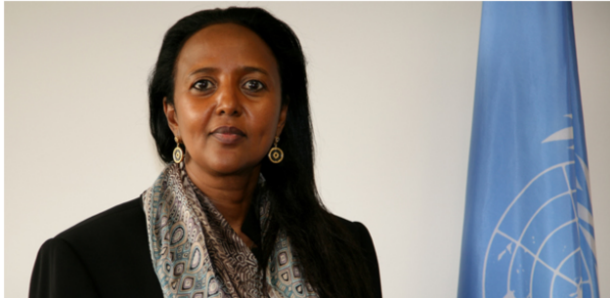
Η Υπουργός Εξωτερικών & Διεθνούς Εμπορίου της Κένυας, Πρέσβυς κα Amina Mohamed.

Στο κοινό ανακοινωθέν που εξέδωσαν οι Υπουργοί Ανατολικής Αφρικής των χωρών της Κοινότητας Ανατολικής Αφρικής (Κένυα, Τανζανία, Ουγκάντα, Ρουάντα, Μπουρούντι), που συναντήθηκαν το Νοέμβριο στο Ναϊρόμπι, τονίζεται ότι ομόφωνα στηρίζουν την υποψηφιότητα της Υπουργού Εξωτερικών & Διεθνούς Εμπορίου της Κένυας, Πρέσβευς κας Amina Mohamed, για τη θέση του Προέδρου της Επιτροπής Αφρικανικής Ένωσης (African Union Commission) επιδοκιμάζοντας έτσι τη σχετική πρόταση της Α.Ε. του Προέδρου της Κένυας, κου Uhuru Kenyatta.