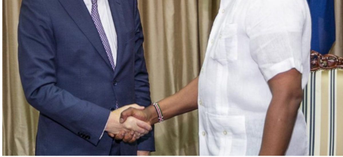
Ο Βέλγος Αν. Πρωθυπουργός και Υπουργός Εξωτερικών, κος Didier Reynders, με την Α.Ε. τον Πρόεδρο της Κένυας, κο Uhuru Kenyatta.

Η Κυβέρνηση του Βελγίου αποφάσισε να χρηματοδοτήσει με περίπου 23 εκατομμύρια ευρώ το μέρος του προγράμματος «Last Mile Connectivity Project» που στοχεύει στη σύνδεση των τοπικών Κυβερνήσεων των Κομητειών με την Εθνική Κυβέρνηση και τα Υπουργεία μέσω της υποδομής του Εθνικού Δικτύου Οπτικών Ινών.