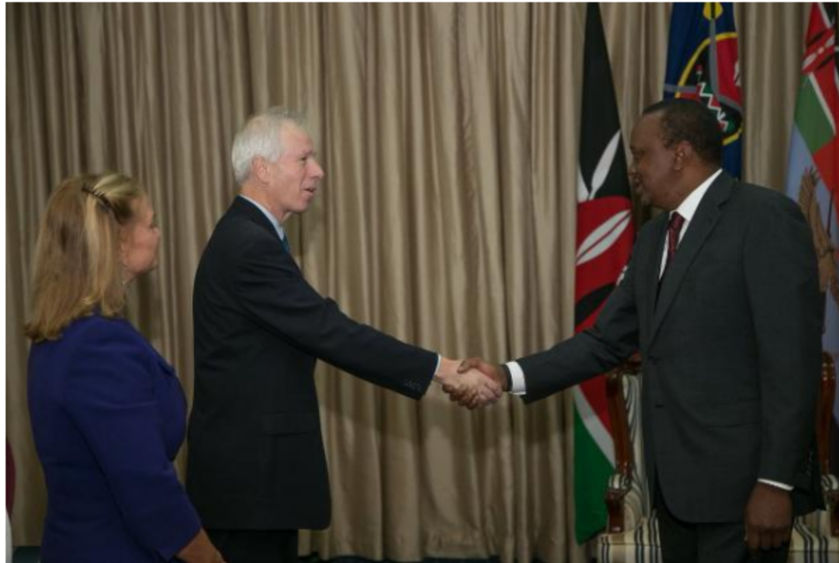
Ο Καναδός Υπουργός Εξωτερικών, κος Stephan Dion, με την Α.Ε. τον Πρόεδρο της Κένυας, κο Uhuru Kenyatta.

Κατά την επίσημη επίσκεψή του στην Α.Ε. τον Πρόεδρο της Κένυας, κο Uhuru Kenyatta, ο Καναδός Υπουργός Εξωτερικών, κος Stephan Dion, αναγνωρίζοντας τον σημαντικό ρόλο της Κένυας στη διασφάλιση της ειρήνης όχι μόνο στην ευρύτερη περιοχή αλλά και διεθνώς, παρότρυνε τη χώρα να συνεχίσει να υποστηρίζει παρόμοιες πρωτοβουλίες.